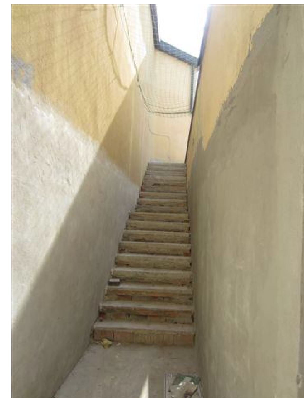
LA NUOVA SCALA DI ACCESSO

IL COSTO COMPLESSIVO E' DI 150.000,00 euro