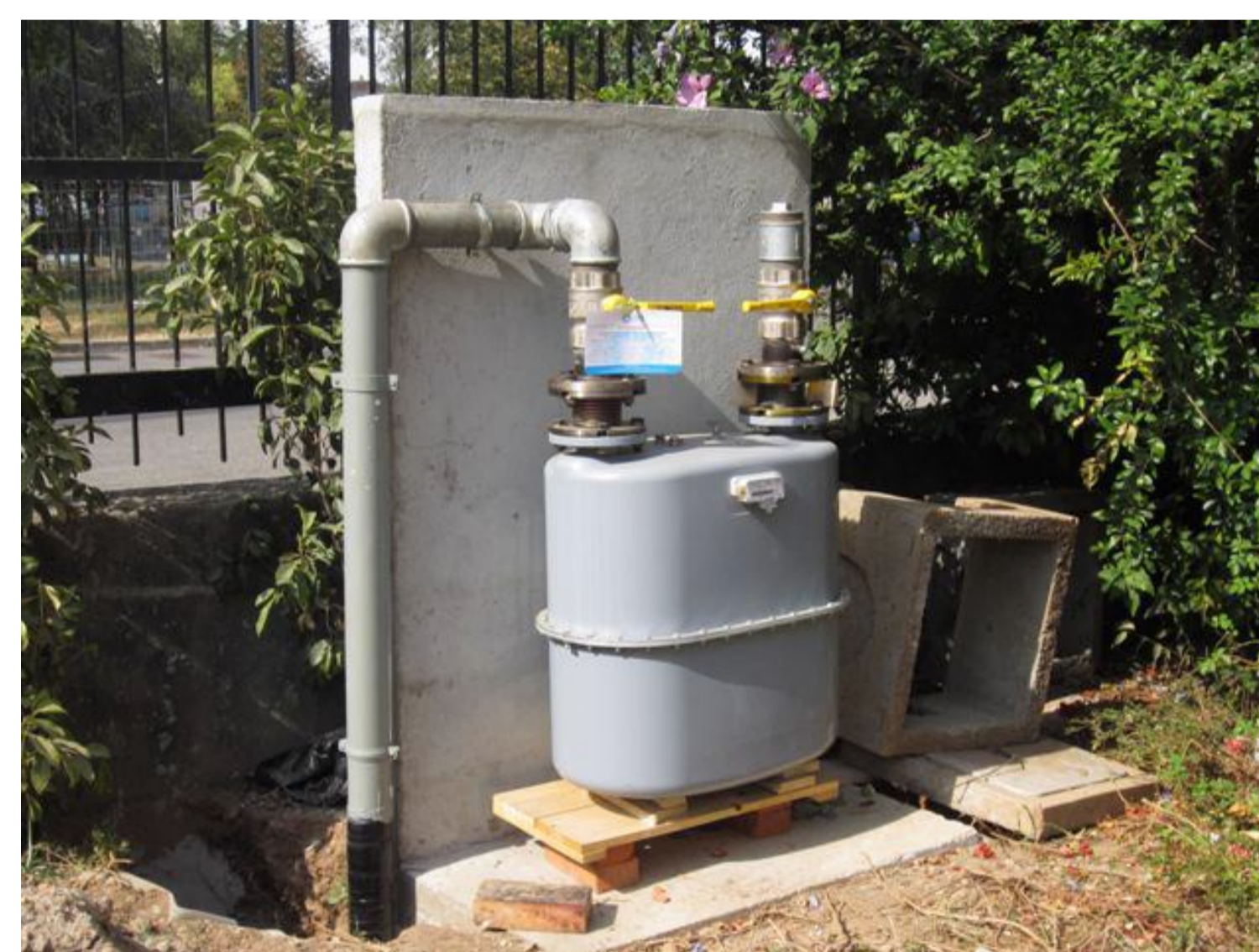
IL NUOVO CONTATORE DEL GAS METANO