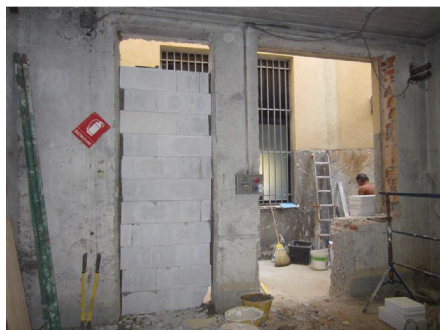
LA "MESSA A NORMA" DEL LOCALE