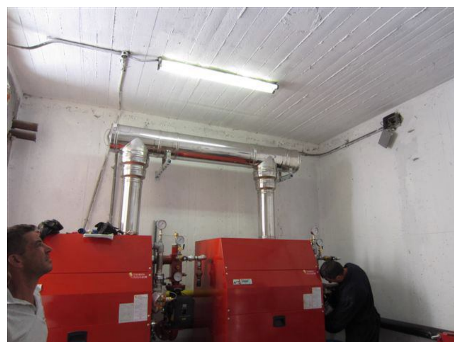
LE NUOVE CALDAIE A CONDENSAZIONE

RIFACIMENTO IMPIANTO DI RISCALDAMENTO ... forse quest'inverno non saremo al freddo.....!!!!