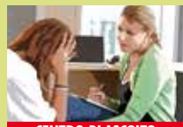
CENTRO DI ASCOLTO