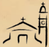
Parrocchia S. Martino in Greco