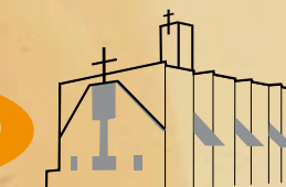
Parrocchia S. Maria Goretti