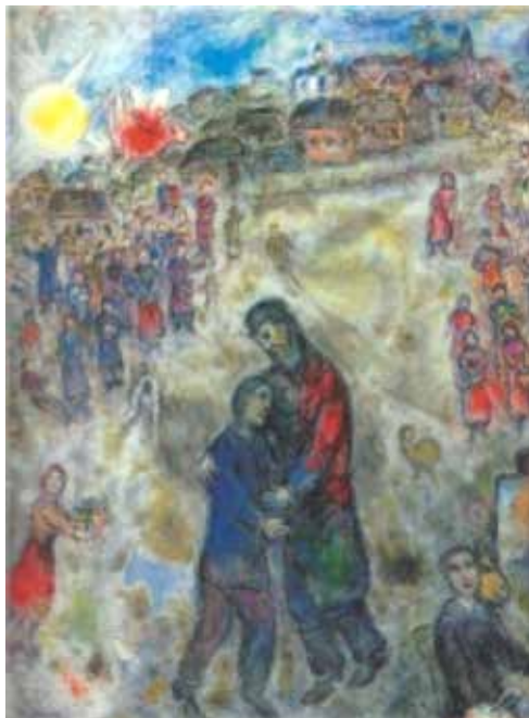
Il Figliol prodigo

Il Museo Diocesano di Milano presenta, dal 17 settembre 2014 al 1 febbraio 2015, "Marc Chagall e la Bibbia", un completamento dell'esposizione che Palazzo Reale dedica all'artista.