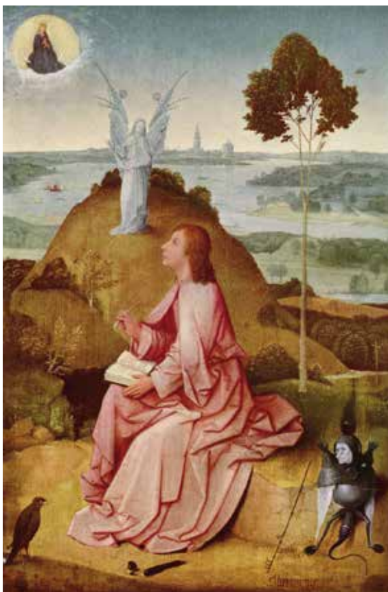
Hieronymus Bosch, L'evangelista Giovanni scrive il Libro dell'Apocalisse (1505)

Quest'estate sono stato a PATMOS (una delle isole del Mar Egeo)